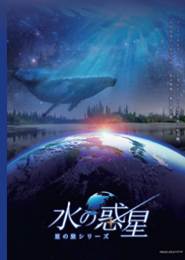
水の惑星／プラネタリウム