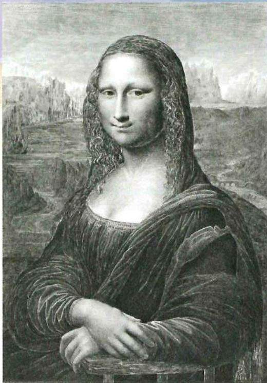
レオナルド・ダ・ヴィンチ「モナリザ」

■主催:北見市美術展実行委員会・北網圏北見文化センター ■協力:RMN-GP(フランス国立美術館連合ーグランパレ)、ルーヴル美術館カルコグラフィー室、 amf(アジャンス・デ・ミュゼ・フランス) ■企画協力:ステップ・イースト ■映像提供:DNPアートコミュニケーションズ(MMM) ■後援:北海道新聞北見支社、NHK北見放送局、株式会社伝書鳩、オホーツク美術協会、 オホーツク管内博物館連絡協議会、北見市 ■協賛:株式会社アース環境、株式会社次の一手、株式会社東部第一、株式会社ホテル黒部、株式会社メンティス、 北ツール株式会社、三九建設株式会社、塩別つるつる温泉、北辰土建株式会社、北海設計株式会社